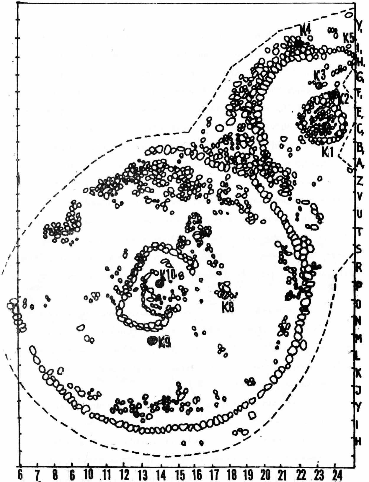
5 pav. Eglieškių pilkapių Nr. 2 (viršuje) ir Nr. 3 (apačioje).