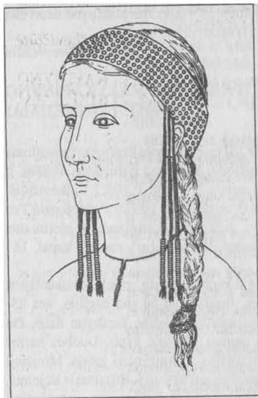
galvos dangos papuošalo rekonstrukcija

visos vienodos- su kabliuku ir kilpele galuose. Ant krūtinės padėta pora smeigtukų, sujungtų grandinėlėmis. Smeigtukai žiediniai, kryžiniai su išplotomis plokštelėmis kryžmų galuose ir kryžiniai su mažomis bruoželėmis. Ant rankų moterims uždėta po apyranke.. Viena kita palaidota su žiedu, gintariniu karoliukų. Kiek retesnės įkapės rastos kape Nr. 119. Labai apardytame moters kape (išlikusi tik galvos sritis) aptiktas darbo įrankių komplektas- geležinė yla, žalvarinė adata ir akmeninė liejimo forma (pav). Pastaroji pagaminta iš smiltainio, yra 5,5x1,7x3cm dydžio. Tai kol kas antroji visoje Lietuvos teritorijoje kape rasta akmeninė liejimo forma. Be minėtų darbo įrankių, dar aptiktas gintarinis dvigubo