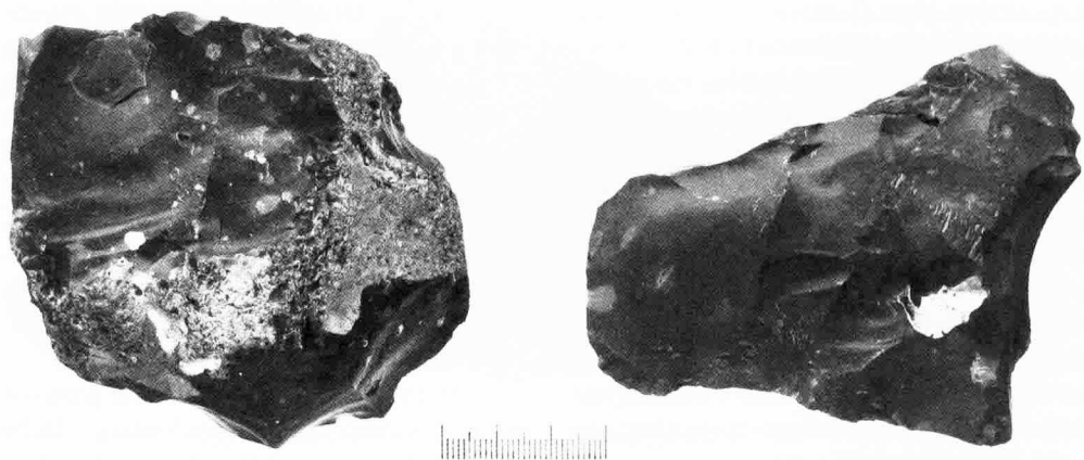
92 pav. Dubičių–Draciliškės 1 senovės gyvenvietėje surasti titnago skladytiniai. Fig. 92. Flint cores from Dubičiai–Draciliškė 1 st settlement.

yra daugiau nei 1 m storio. Objekto teritorija nustatyta pagal paviršinių radinių išplitimą. Žvalgomųjų tyrimų metu nustatyta, kad gyvenvietės kultūrinis sluoksnis ženkliai apardytas ilgalaikių arimų.