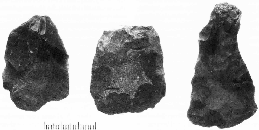
93 pav. Dubičių–Draciliškės 1 senovės gyvenvietėje surasti titnaginiai kirveliai. Fig. 93. Flint axes from Dubičiai–Draciliškė 1 st settlement.

patina. Aptikta įvairių tipų skaldytinių, retušuotų skelčių ir nuoskalų, gremžtukų, gražtų / ylių, peilių, kirvelių ir kt. (92, 93 pav.). Gausu ir skaldyto, deginto akmens. Keramika irgi įvairių tipų: klasikinio narviško tipo su augalinėmis priemaišomis, neolitinė su minerali-