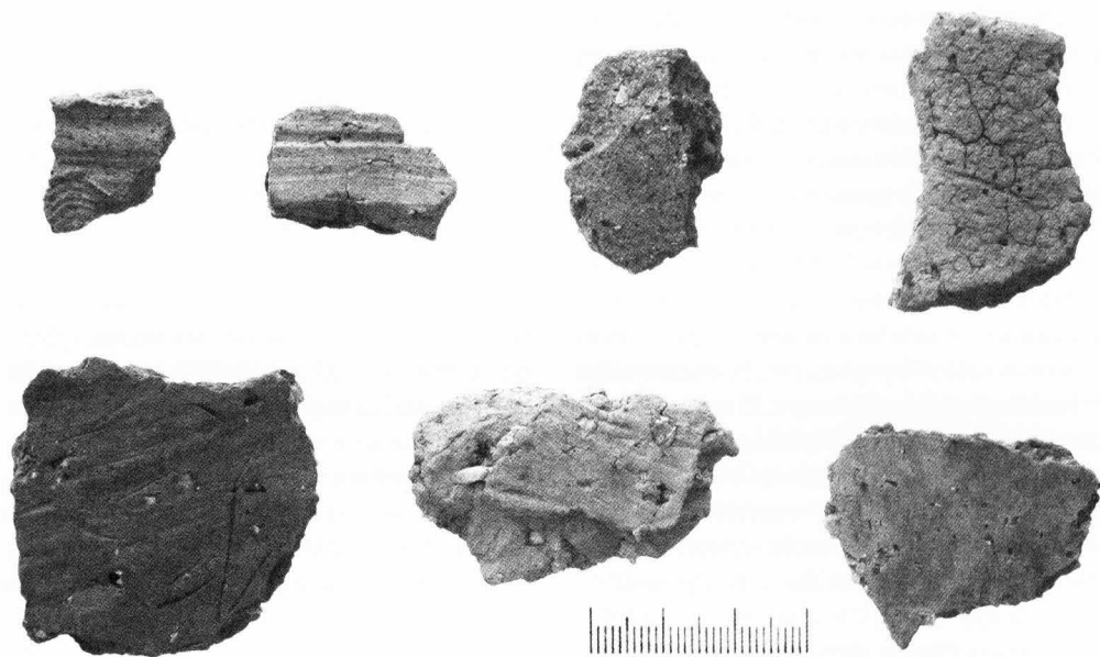
94 pav. Dubičių–Draciliškės 1 senovės gyvenvietėje surastos bronzos–geležies amžiais ir X–XIV a. datuojamos puodų šukės.