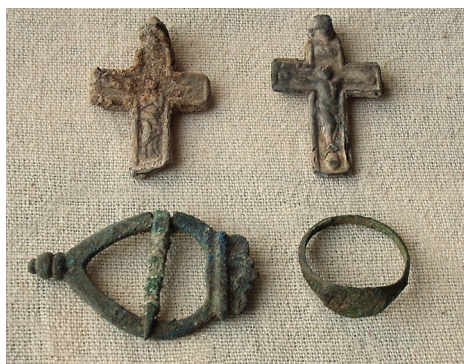
2 pav. Atsitiktiniai dirbiniai iš kapų: 1–2 – alavuoti kryželiai, 3 – žalvarinė segė, 4 – signetinis žiedas.