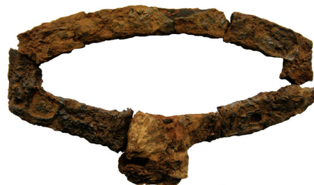
0 3 cm