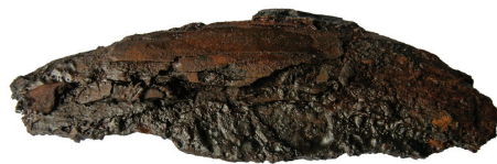
0 3 cm