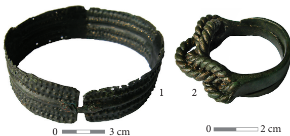
7 pav. Juostinė apyrankė (1) ir vario lydinio žiedas pinta priekine dalimi (2) iš moters kapo 11.

Kaukolės pakaušio srityje išlikęs plaukų kuokštas, keli labai sunykę išdirbtos gyvulio odos fragmentai ir tvirtinimo detalių fragmentai (apkalėliai, sagtelė?) iš vario lydinio.