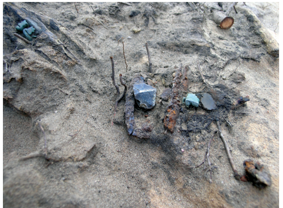
12 pav. Vyro kape 12 prie šlaunikaulio aptiktas odinis kapšas.

1990 m. užvažiuojamųjų namų P pusėje kasant tranšėjas elektros kabeliui, aptikti mūrai, kurie architekto S. Lasavicko nuomone, yra vaidilučių ar kitų tarnų gyvento pastato liekanos. Hipotetiniai mūrai fiksuoti 1–1,7 m pločio tranšėjose. Siekiant plačiau iširti šią