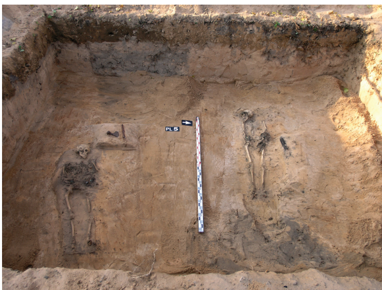
1 pav. Kapas 2.