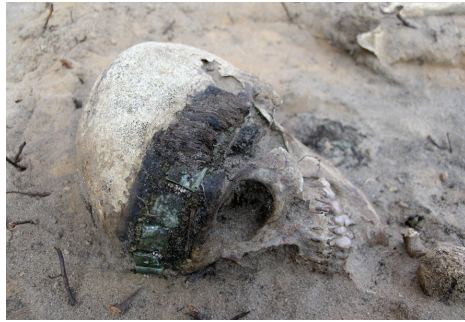
3 pav. Apgalvis in situ iš moters kapo 11.

Plotas 3. 11 m 2 dydžio plotas kastas kalno keteros Š šlaite, prie asfaltuoto keliuko, Verknės upelio V šlaitu vedančio link vandens malūnų. Po velėnos sluoksniu buvo 30–60 cm storio maišytas tamsiai pilkos žemės ir smėlio sluoksnis su gausiomis medžių šaknimis. Po juo pasiektas smėlio žemės ( H_{abs} 140,08–139,80 m). Ploto PV dalyje, 90 cm gylyje atkasti skeleto kojų kaulai. Padarius plotą išpjovą, visiškai atidengtas 20–30 m. moters skele-