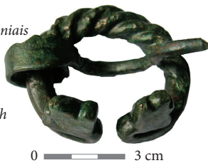
Fig. 11. A copper alloy penannular brooch with zoomorphic terminals from burial 12.