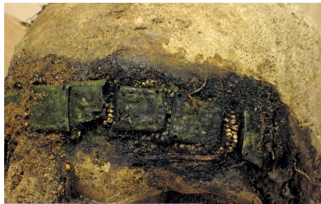
Fig. 3. A chaplet in situ from female burial 11.