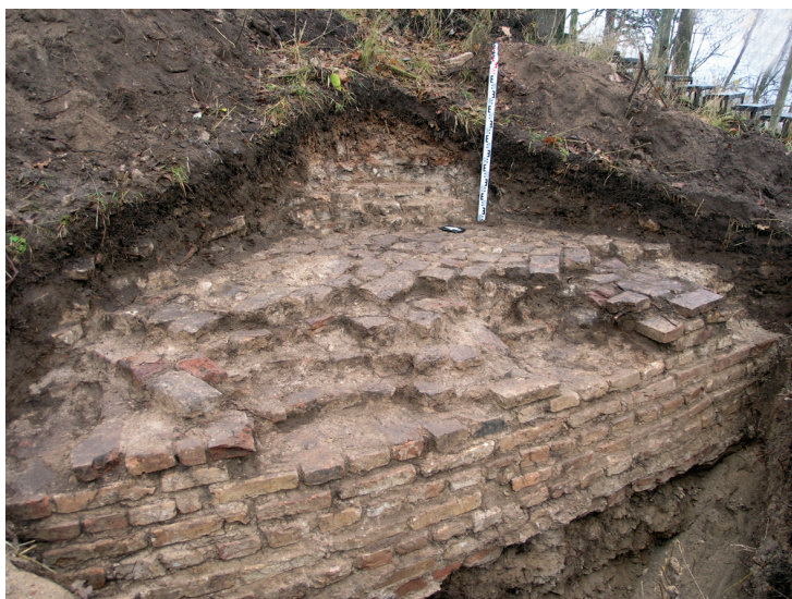
15 pav. 1850 m. statytos rotondos – apžvalgos aikštelės pamato fragmentas plote 11.

Fig. 15. A fragment of the 1850 rotunda – observation deck in area 11.