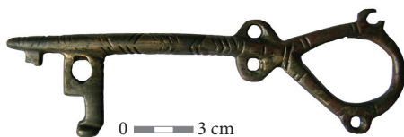
8 pav. Vario lydinio azūriniai raktai iš moters kapo 11.