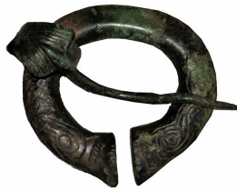
Fig. 2. The penannular brooch from Domantai.

plotas žvalgytas metalo ieškikliu, tačiau be XX a. šiukšlių buvo rastas tik mažas suvytos žalvarinės vielos fragmentas, Livonijos šilingas (Karolis X Gustavas, 1654–1658 m.), katalikiškas medalikėlis ir 1931 m. Virbalio muitinės plomba. Tai turėtų reikšti, kad smeigtukas ten pateko atsitiktinai, arba, kad kapinyno palaidojimai yra giliau, nei pasiekia plūgas.