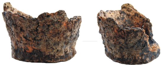
2 pav. Šventosios upėje rasta grublėtoji keramika.

Fig. 1. A bone harpoon head and a small hook that were found in the river Šventoji. 0 — 3 cm