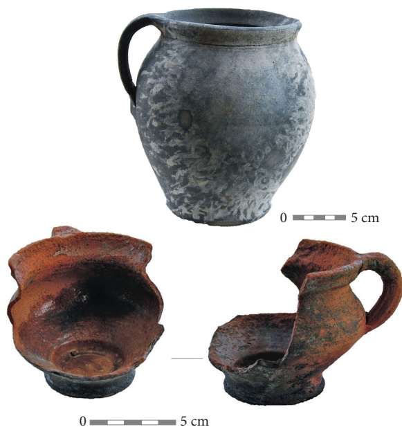
5 pav. Vainežerio ežere rasta keramika.