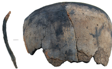
4 pav. Suvingio ežere rasta keramika.

Stirnių ežere (Molėtų r.) žvalgytas 85 ha plotas. Šalia iškyšulio, esančio ežero P dalyje,