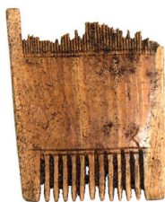
Fig. 3. The bone comb from area 140.

3 pav. Kaulinės šukos iš ploto 140.