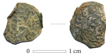
10 pav. Rygos šilingas iš ploto 70.

Plote 81 atidengta ir preparuota molio kasimo duobė (likusi duobės dalis yra už ištirtos plotos P ribos), kurios gylis siekė 5,2 m (12, 13 pav.). Pagal archeologinius radinius ji galėjo būti naudojama nuo XVI a. (?). Šalia jos įžemyje preparuotos dar kelios duobės su XVII–XVIII a. radiniais. Plote 81, molio kasimo duobėje surasta ypač daug archeologinių radinių – įvairių