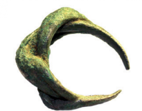
Fig. 2. The ring with the braided bezel from area 140.

2 pav. Žiedas su pinta priekine dalimi iš ploto 140.