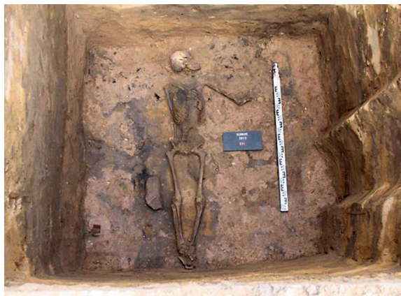
5 pav. Plote 114 atidengtas palaidojimas.

Iširta siurblynės vieta (plotas 65; 45 m 2 dydžio). Rasta XIV a. datuojama ūkinė duobė su buitine keramika (6 pav.), metalo lydymo atliekomis bei dideliu kiekiu gyvulių kaulų ir ypačiaisiais radiniais: žalvarinėmis šukomis,