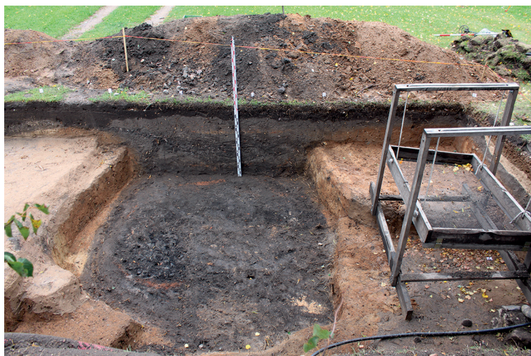
12 pav. Plote 81 surasta molio kasimo duobė.

Fig. 12. The clay extraction pit found in area 81.