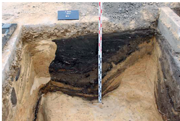
6 pav. Plote 65 fiksuotos ūkinės duobės pjūvis.

Fig. 5. The burial unearthed in area 114.