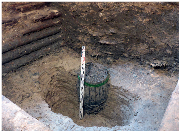
1 pav. Rūsyje rasto medinio rentinio statinio centrinėje dalyje fiksuota įkasta medinė statinė. Fig. 1. The half-buried wooden barrel recorded in the central part of a log structure in the cellar.

1,7x1,7 m dydžio šulinys ( perkasa 12 ) fiksuotas įkastas į molį sklypo vidiniame kieme,