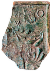
Fig. 2. Finds discovered during the investigation.

2 pav. Tyrimų metu rasti radiniai.